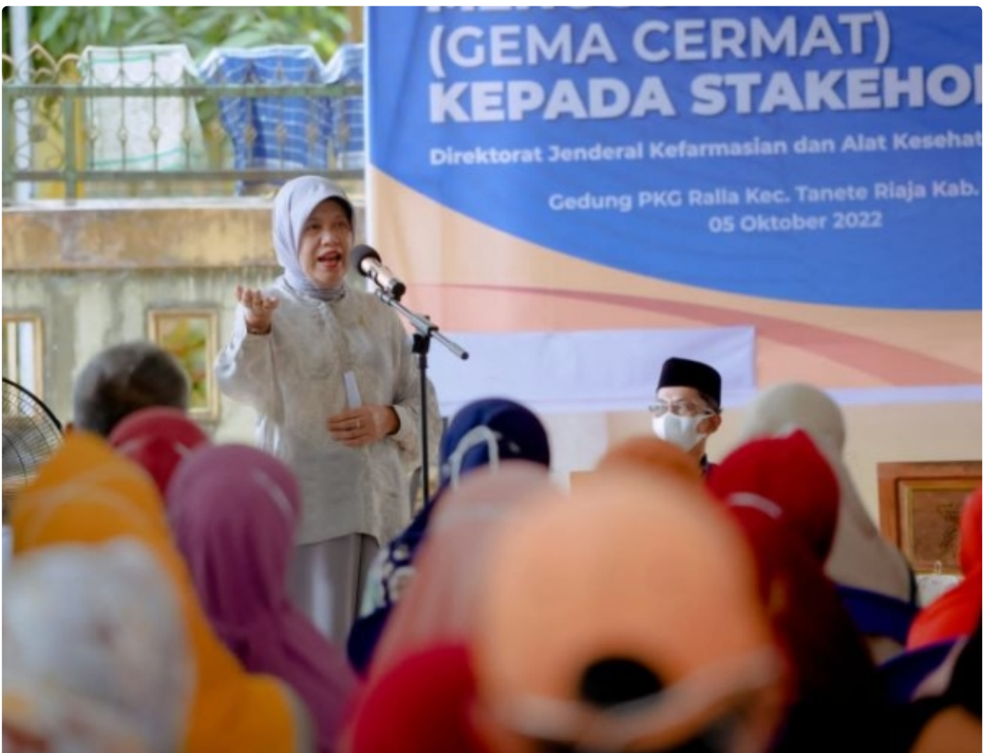
Anggota DPR RI, drg. Hj. Hasnah Syam, MARS

BARRU- Sosialisasi Gerakan Masyarakat Menggunakan Obat (Gema Cermat) dan Optimalisasi dalam rangka mendukung Germas Oleh Anggota Komisi IX dan Kementerian Kesehatan Republik Indonesia (Kemenkes RI).